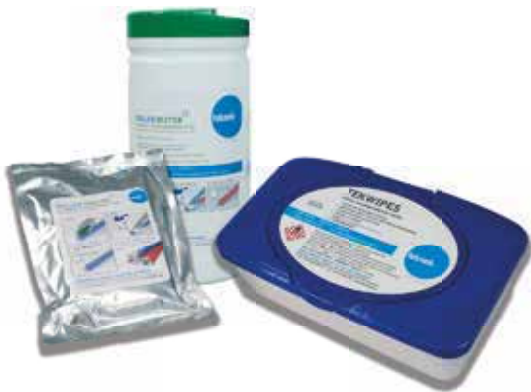
Roller Maintenance Products

NWP 600 & 750 widths are available or request