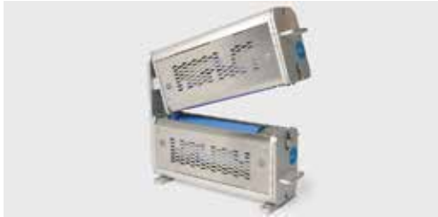
安全で確実なアクセス特性