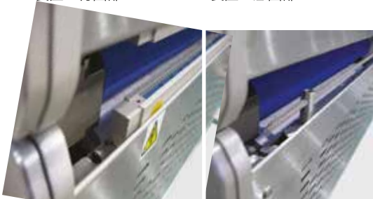
アクティブ型静電気除去システム