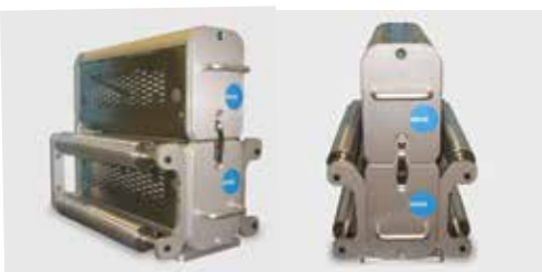
オプションのガイドロール