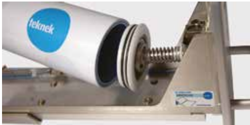
ユニークな粘着ロール保持機能