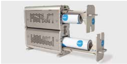
テクネック製カット済み粘着ロールへのサイドアクセス