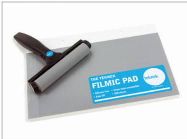
Nanoclean™ フィルムパッドと併用 – 1冊100シート入