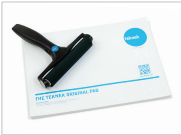
NT™ 紙パッドと使用 – 1冊50シート入